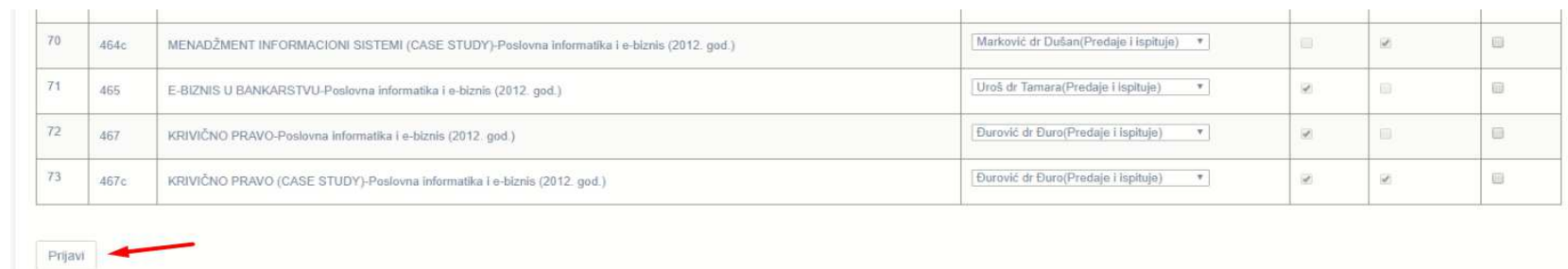
Слика 5 – Пријава испита

Након избора предмета за пријаву испита, потребно је кликнути на дугме „Пријави“ које се налази на дну странице.