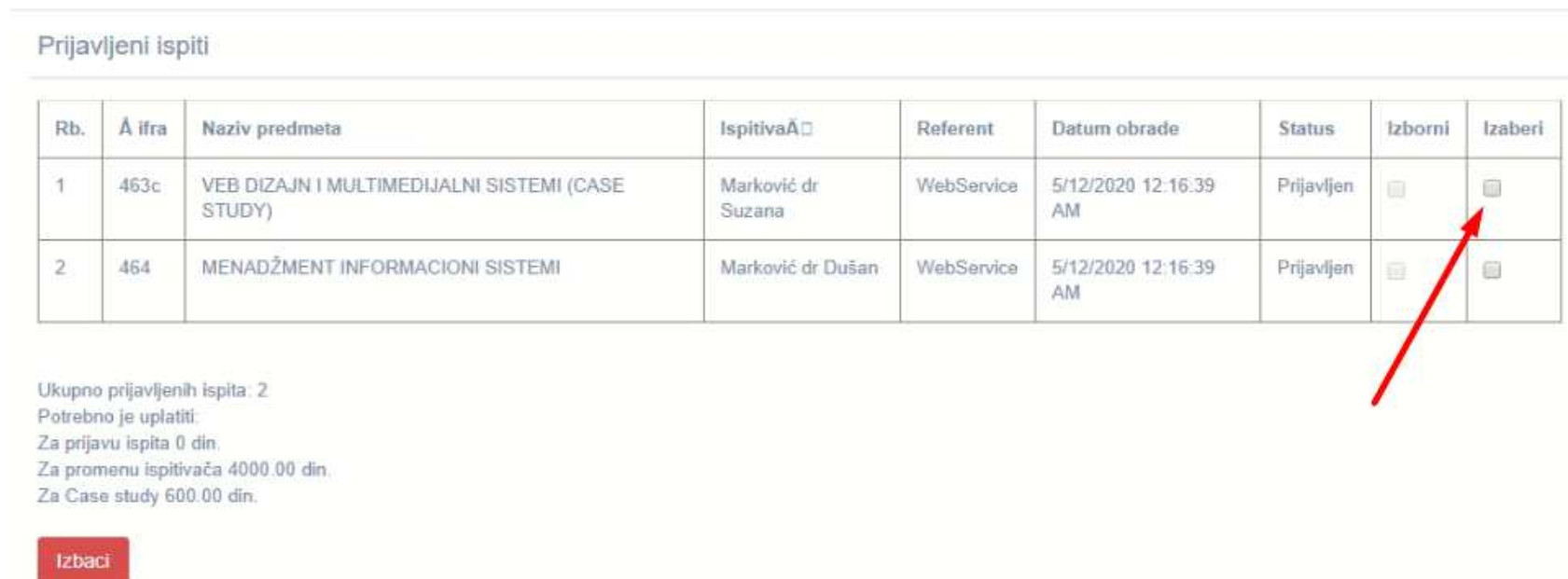
Слика 7 – Избор предмета за одјаву испита

Уколико се студент предомисли и жели да промени одлуку о пријави испита, потребно је да обележи предмет, који ипак не жели да полаже. Студент може да се мења мишљење везано за пријаву испита све до краја рока за редовну пријаву испита.